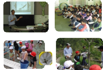
* プールの生きもの救出作戦！ * 専門家の講師を招いての生きもの観察会