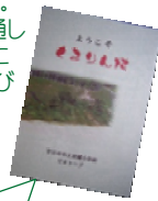
9年間のあゆみをまとめた“誕生記”が出来ました！

宮園小学校では、生活科・理科・道徳・クラブ活動など、全学年でビオトープを活用して学習を行っています。特に3年生は1年を通して総合的な学習の時間にさまざまな体験をし、学びを深めています。