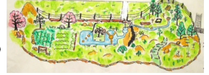
H.23 現在のくるりん村 (横TOM×奥行315M)