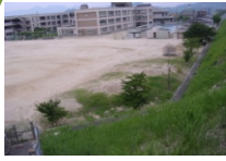
H.15 保護者の願いからビオトープづくりがスタート