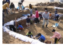
H.17 かめさん池づくり 児童と大人が力を合わせて