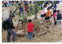
H.16 ドングリの記念植樹以降、種から育てる