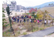
H.19 せせらぎ川づくり 川の形に手をつなぐ